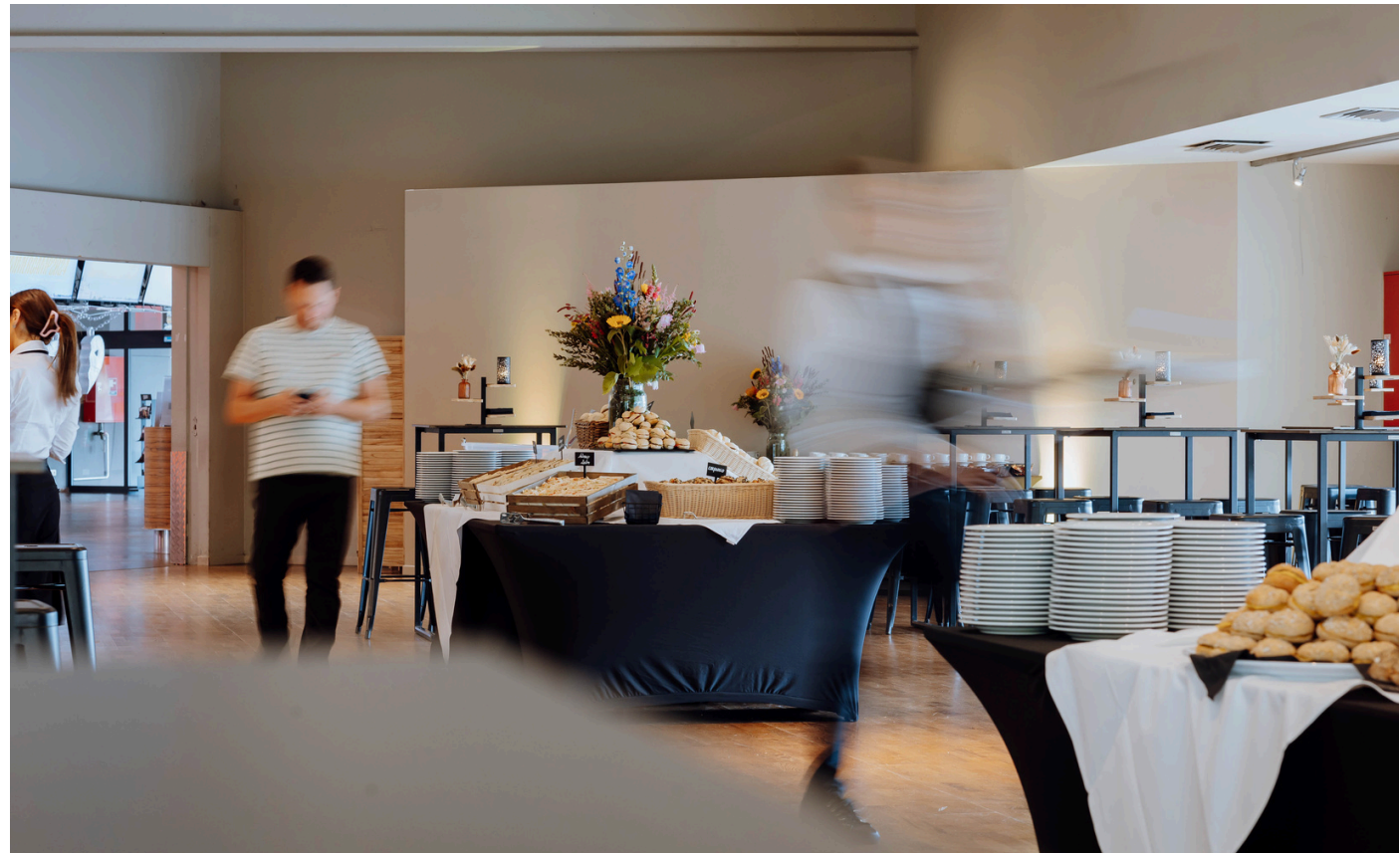
CATERING TAKE TWO